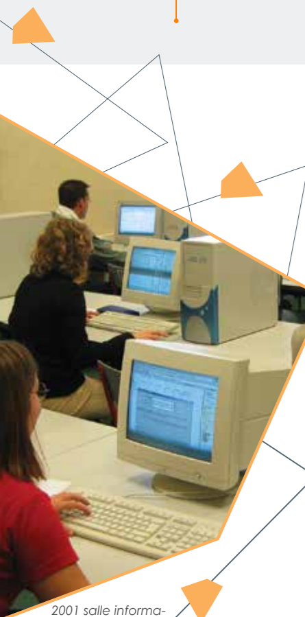
2001 salle informatique Duguesclin