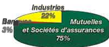
Origine de la taxe

La collecte 2004 (en augmentation de 20% par rapport à celle 2003) s'élève à 61 000 Euros, avec un mode de versement réparti, de façon assez équilibrée, entre collecte directe et collecte indirecte.