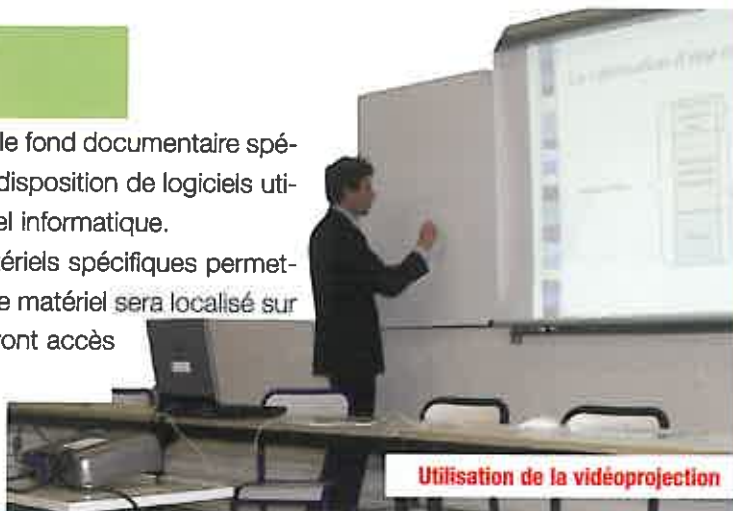
Utilisation de la vidéoprojection

La taxe d'apprentissage permettra aussi le financement d'interventions diverses de professionnels (notamment sur les métiers et débouchés à l'issue nos formations).