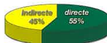
Mode de collecte

Pour l'année 2004 la répartition entre les catégories de collecte est de 2/3 pour la catégorie Cadres Supérieurs et de 1/3 pour celle des Cadres Moyens. Nous ne pourrons plus, à venir, collecter dans la catégorie des Ouvriers Qualifiés, nos formations étant habilitées en catégorie 3.